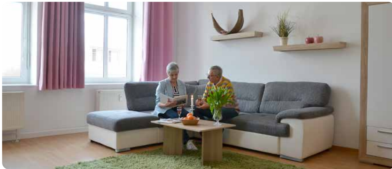
Das ist eine der Wohnungen, welche die GuWo für das Probewohnen zur Verfügung stellt.

35 Bewerbungen für das Probewohnen 2024, Start im Juli