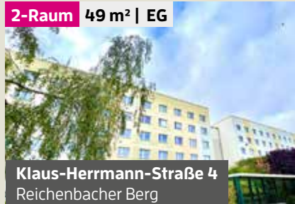
Klaus-Herrmann-Straße 4 Reichenbacher Berg