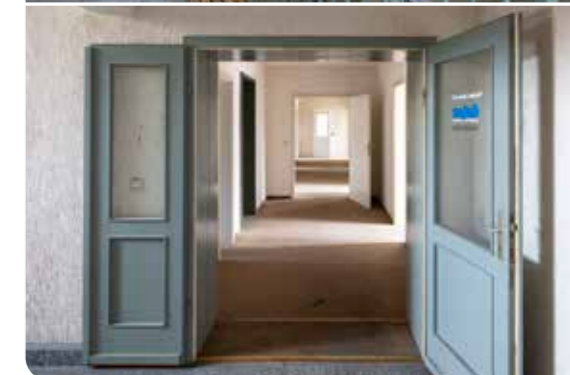
Blick in den künftigen Verwaltungssitz von GuWo und GSW.