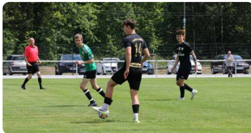
Torreiches Eröffnungsspiel: Die Partie endete 6 zu 1.

Gleich sieben Tore sahen die Zuschauer des Eröffnungsspiels, mit dem das modernisierte Sportzentrum Kaltenborn Ende Mai eröffnet wurde. Die Fußballpartie zwischen Spielern des 1. FC Guben e.V. sowie des Breesener Sportverein Guben Nord e.V. gegen das polnische Team „Carina Gubin“ endete mit 6 zu 1 für die Gäste aus der Nachbarstadt. Im Publikum saßen neben Bürgermeister Fred Mahro auch Ministerpräsident Dietmar Woidke und die ehemaligen Bundestagsabgeordneten Ulrich Freese sowie Klaus-Peter Schulze. Das Spiel war der Höhepunkt der feierlichen Einweihung des Sportzentrums. Ein Teil der Außenanlagen des Sportzentrums war in den vergangenen knapp zwei Jahren für insgesamt 3,5 Millionen Euro rundum erneuert worden. So wurde ein neues Großspielfeld mit einer energieeffizienten Beleuchtungs- und Beregnungsanlage errichtet, neue Aufwärmbereiche und Freiflächen geschaffen und die Tribüne erneuert. Im öffentlichen Bereich der Anlage entstanden ein Fitnessparcours