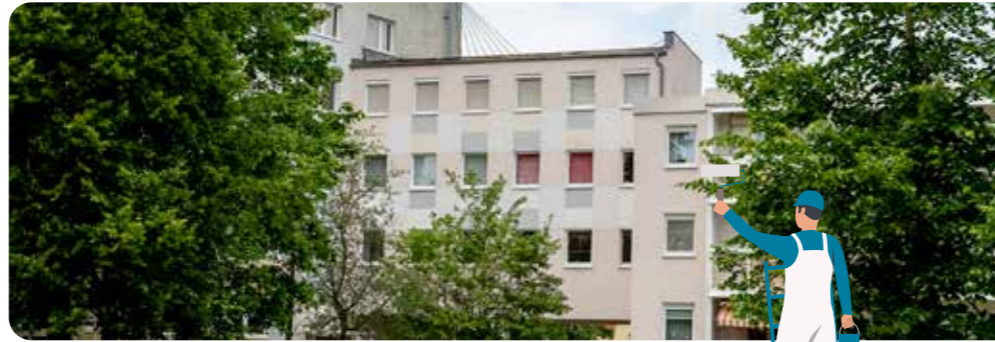
Dieser Verbinder an der Kaltenborner Straße 168 wird um ein Geschoss reduziert und der Durchgang verschlossen. Dort entsteht ein Abstellraum für Fahrräder, Kinderwagen und Rollatoren.

Stadtumbau, wie ihn Guben seit Jahren erlebt, bedeutet oft genug Kompromisse. Altes verschwindet, Neues entsteht. Mit jedem Rückbau müssen sich die betroffenen Mieter neu orientieren. Die GuWo kommt ihren Mietern dabei so gut es geht entgegen und sucht nach Lösungen, wie ein aktuelles Beispiel aus dem Wohngebiet Gubener Dubrau zeigt. Dort wird im kommenden Jahr der Block Dr. Külz-Straße 7-13 abgerissen. Über einen Verbinder ist er mit dem Wohnhaus Kaltenborner Straße 168 verbunden, das ebenfalls zur GuWo gehört und stehen bleiben soll. Zwei Familien aus der Kaltenborner Straße haben in dem Verbinder jeweils ein Zimmer. Da der Verbinder ebenfalls für den Abriss vorgesehen war, hätten sie dieses Zimmer aufgeben müssen. „Verständlicherweise können und wollen die beiden Familien nicht einfach