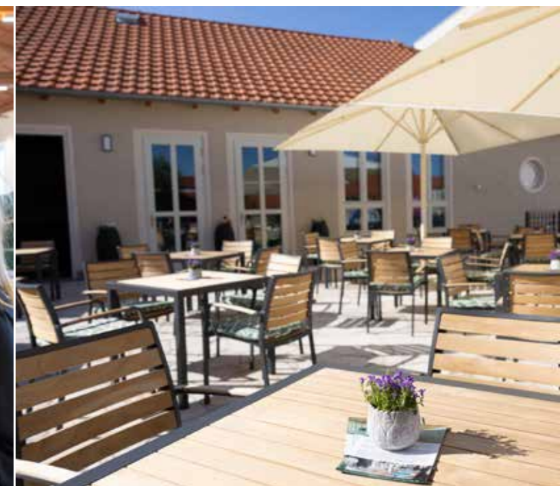
Foto links: Bei der Einrichtung wurden historische Elemente wie die Holzdecke und die Plastiken mit modernem Mobiliar kombiniert. Fotos rechts: Die Terrasse, die zum Tag der offenen Tür im Pflegefachzentrum gut besucht war, bietet Platz für bis zu 80 Personen.

Wie sehr in der Altstadt West bisher ein gutes Restaurant gefehlt hat, zeigte der Ansturm, den das „Wilhelm“ in den ersten Tagen erlebte. Schon am ersten Öffnungstag anlässlich der Einweihung des Pflegefachzentrums am 1. Mai kamen Besucher und Neugierige in Scharen. Das Restaurant, das mit seinem Namen an die einstige Wilhelm-Pieck-Schule an dieser Stelle erinnert, hat im Innenraum Platz für 60 Personen und auf der Terrasse für bis zu 80 Personen. Und die waren am Tag der offenen Tür gut nachgefragt, sei es während der geführten Rund-