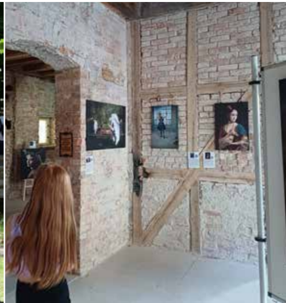
Die Gäste konnte nicht nur tolle Kostüme bewundern, sondern auch einen Blick ins Torhaus samt Ausstellung werfen.