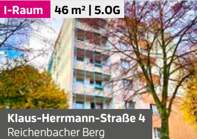
Klaus-Herrmann-Straße 4 Reichenbacher Berg