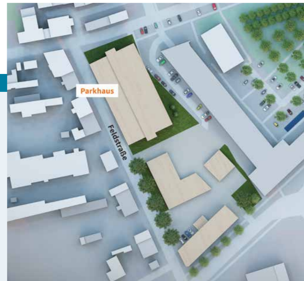
Die Skizze zeigt den künftigen Verwaltungssitz der beiden kommunalen Unternehmen (im Bild unten mittig). In direkter Nähe könnte ein Parkhaus entstehen.

starten. Der jetzige Verwaltungssitz in der Straupitzstraße soll abgerissen werden, damit dort Platz für einen Nahversorger entstehen kann, der bisher in der Innenstadt fehlt. Wenn die Stadtverordnetenversammlung dem Vorhaben City-Quartier zustimmt, geht es anschließend am Gubener Dreieck weiter. So soll die Innenstadt in den kommenden Jahren behutsam weiterentwickelt und belebt werden.