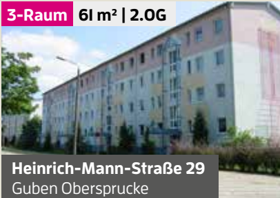
Heinrich-Mann-Straße 29 Guben Obersprucke