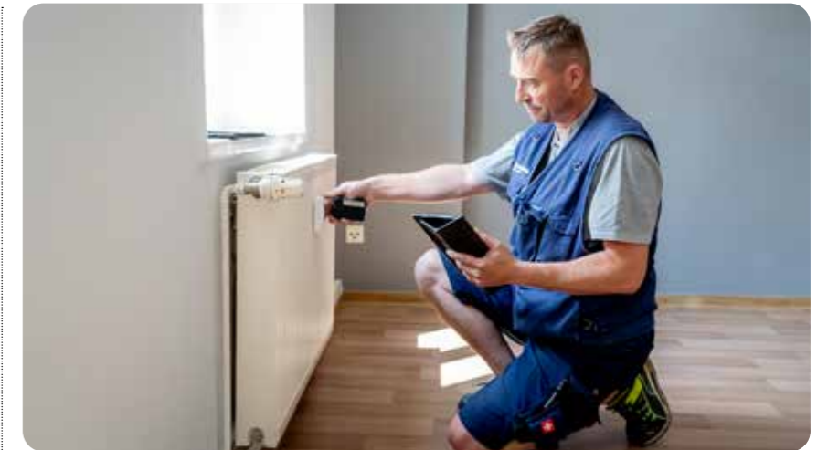
Die Mitarbeiter der GuWo.services werden nach und nach die Heizungen in den GuWo-Wohnungen mit modernen, fernablesbaren Zählern ausstatten.

Sie können entscheiden, ob sie die Information per E-Mail, in einer App oder klassisch per Brief erhalten. „Da-