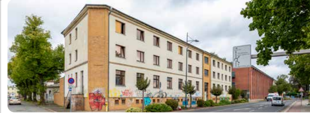
Das leerstehende Bürohaus (Foto links) wird zum neuen Verwaltungssitz von GuWo und GSW.

Unweit vom geplanten City Quartier entsteht in der Gasstraße 8 der neue Sitz für die GuWo-Unternehmensgruppe. In dem leerstehenden Bürogebäude wird künftig die Verwaltung der GuWo, der Gubener Sozialwerke, der GSW Service und der GuWo.Services sitzen. Das Haus bietet nach Modernisierung und Umbau die Möglichkeit, alle Verwaltungsmitarbeiter der zuletzt gewachsenen Unternehmensgruppe künftig an einem Ort unterzubringen. Die Kollegen werden dort nicht getrennt nach Firmen sondern nach Tätigkeitsfeldern zusammensetzen. So wird es zum Beispiel einen gemeinsamen Empfang geben und eine gemeinsame Buchhaltung. Ein weiterer Vorteil an dem Gebäude ist die barrierefreie Erreichbarkeit durch einen Aufzug im Haus. Auf dem Hof sollen Werkstätten für die Handwerker der GuWo.Services entstehen. Das GuWo-Tochterunternehmen deckt die Gewerke Heizung/ Sanitär, Maler/ Fußboden/Fliesenlegerarbeiten sowie Messdienste ab. Dort müssen zunächst die Baracken abgerissen wer-