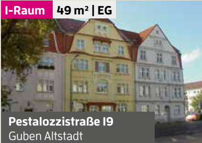
Pestalozzistraße 19 Guben Altstadt