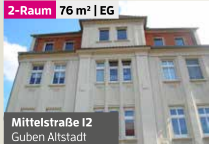
Mittelstraße 12 Guben Altstadt