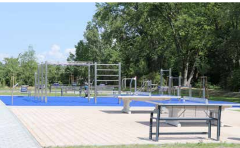
Bild links: Dieser Fitness-Parcours ist Teil des für 3,5 Millionen Euro neugestalteten Sportzentrums Kaltenborn. Bild rechts: Den erste „Spatenstich“ im August 2022 absolvierte Bürgermeister Fred Mahro mit schwerem Gerät.

lung auch bei nasser Witterung möglich. Die neuen Außenanlagen können nicht nur die ortsansässigen Sportvereine nutzen, sondern auch die Schulen der Stadt. Die öffentlich zugänglichen Bereiche mit Bowls-Platz und Parcours stehen allen Gubernern offen.