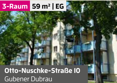
Otto-Nuschke-Straße 10 Gubener Dubrau